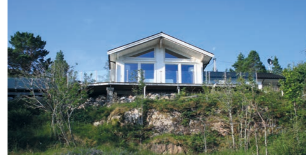
Das idyllisch gelegene Ferienhaus

Ihr möchtet auch mal in der Åfjord-Kommune angeln und Dorsche, Köhler, Pollack, Heilbutte, Seeteufel & Co fangen? Idyllisch am Wasser gelegen, besticht das Traumhaus mit großzügiger und moderner Ausstattung sowie einer riesigen Holzterrasse. Besonders Familien