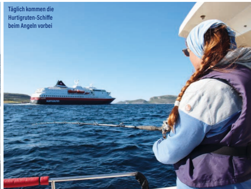
Täglich kommen die Hurtigruten-Schiffe beim Angeln vorbei