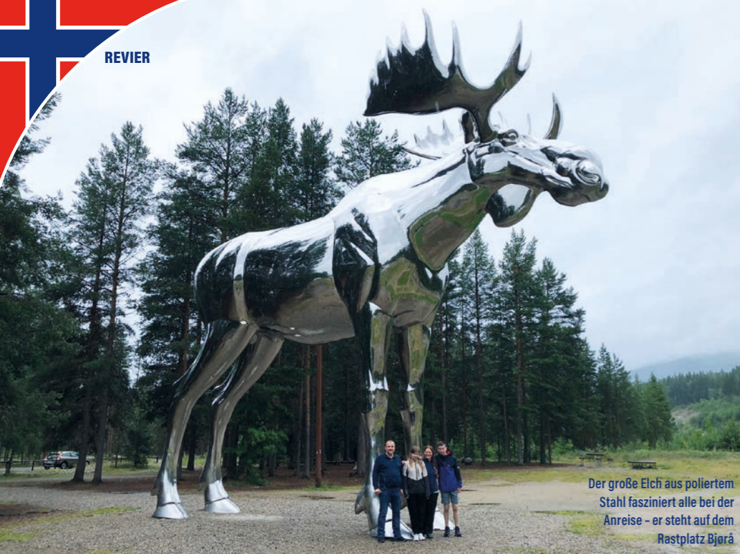
Der große Elch aus poliertem Stahl fasziniert alle bei der Anreise – er steht auf dem Rastplatz Bjørå

Es ist Sommer und Ferienzeit: Mitte Juli 2024 beginnt das große Abenteuer und der Familienurlaub nach Norwegen. Unser Auto ist bis unters Dach gepackt, jede noch so kleinste Lücke wurde ausgenutzt. Zusammen mit meiner Freundin Svenja und Tjorven sowie Matti soll es hoch in den Norden gehen. Angeln steht natürlich auf dem Programm – aber auch Erholung, gutes Essen, wandern, schwimmen und andere Aktivitäten. Gegen Mittag fahre ich mit meinem Pkw auf die Color Line-Fähre in Kiel. Dort gibt es für Tjorven und Matti erst einmal viel zu entdecken. Während