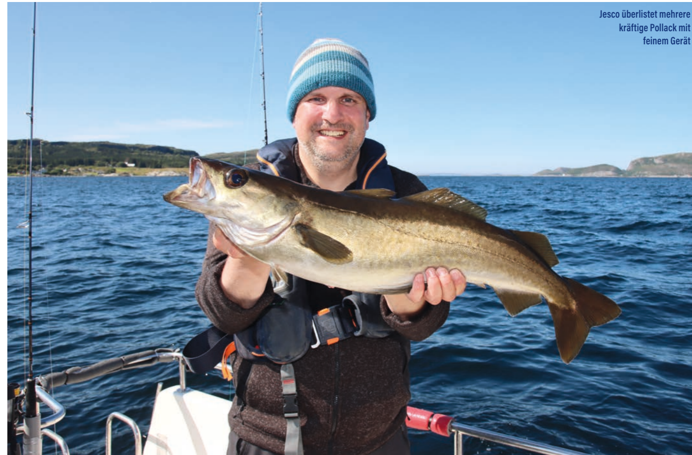
Jesco überlistet mehrere kräftige Pollack mit feinem Gerät