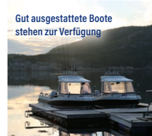
Gut ausgestattete Boote stehen zur Verfügung

oder Paare finden hier ausreichend Platz für erholsame Urlaubstage. Verschiedene gut ausgestattete Boote sind buchbar, mit denen Ihr die Hotspots schnell erreicht. Der Whirlpool lädt mit traumhaftem Blick übers Wasser zum Entspannen ein. Alle Infos zum Revier und zur Buchung erhaltet Ihr über Ferienhäuser Boch auf www.fehwb.de oder telefonisch unter (02191) 60 89 87.