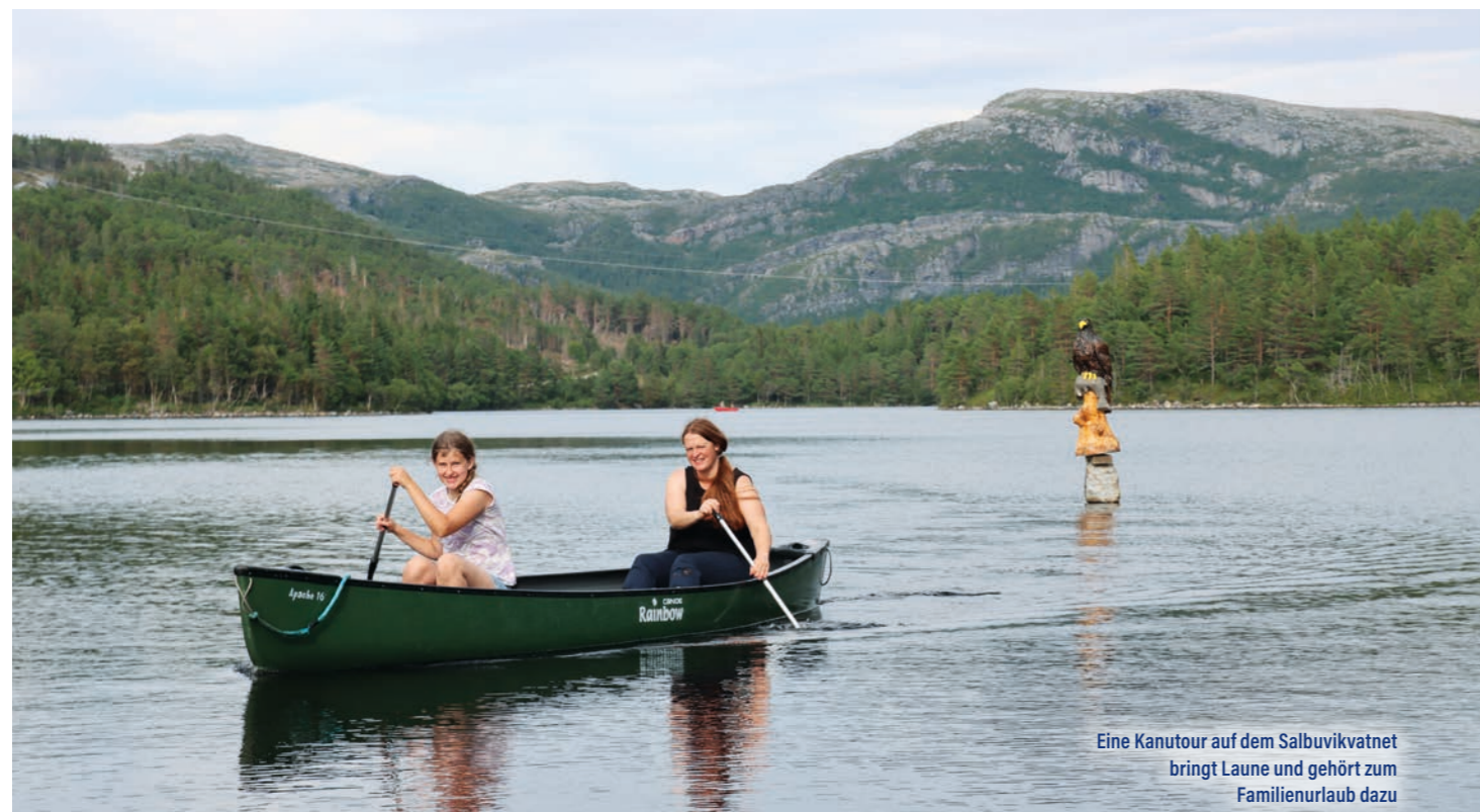
Eine Kanutour auf dem Salbuviivatnet bringt Laune und gehört zum Familienurlaub dazu