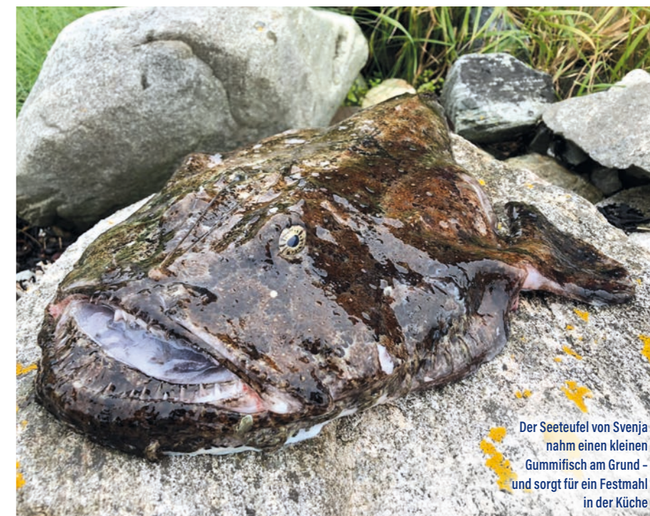
Der Seeteufel von Svenja nahm einen kleinen Gummifisch am Grund – und sorgt für ein Festmahl in der Küche