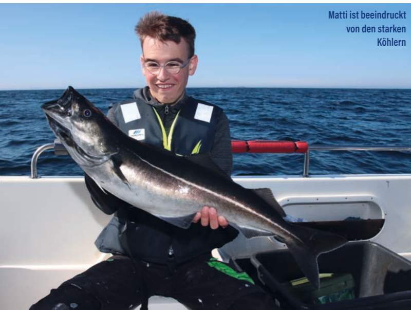
Matti ist beeindruckt von den starken Köhlern

unser Ferienhaus. „Wow, ist das traumhaft schön“, freuen sich Tjorven und Matti. Dieses haben wir über Ferienhäuser Boch gebucht und liegt direkt am Paulen, einer bis