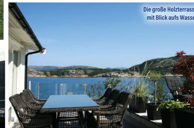
Die große Holzterrasse mit Blick aufs Wasser

oder Paare finden hier ausreichend Platz für erholsame Urlaubstage. Verschiedene gut ausgestattete Boote sind buchbar, mit denen Ihr die Hotspots schnell erreicht. Der Whirlpool lädt mit traumhaftem Blick übers Wasser zum Entspannen ein. Alle Infos zum Revier und zur Buchung erhaltet Ihr über Ferienhäuser Boch auf www.fehwb.de oder telefonisch unter (02191) 60 89 87.