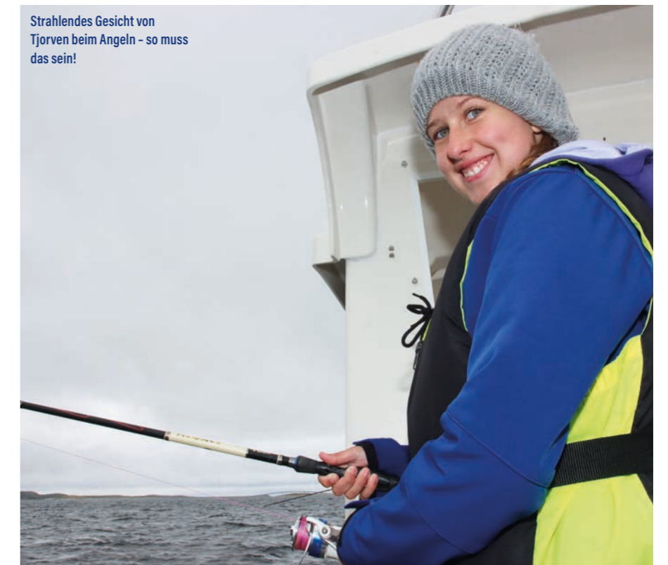
Strahlendes Gesicht von Tjorven beim Angeln - so muss das sein!

weite der Insel Linesøya eine Kette von Plateaus an, die von tieferem Wasser umgeben sind. Bei 50 bis 70 Meter unter dem Boot kracht es dann gewaltig und wir ha-