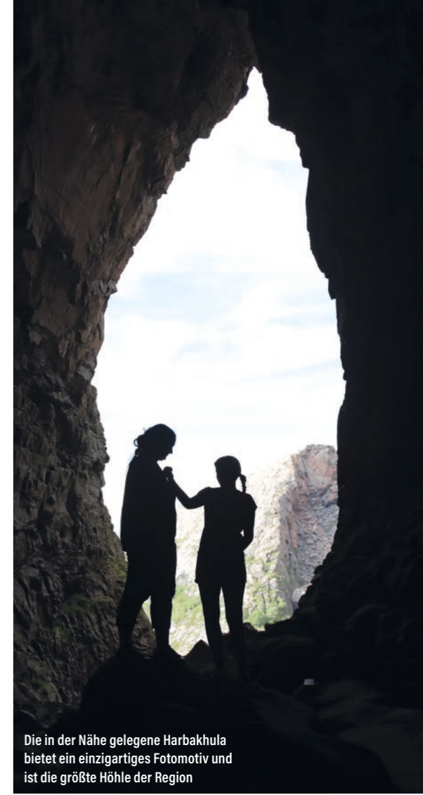
Die in der Nähe gelegene Harbakhula bietet ein einzigartiges Fotomotiv und ist die größte Höhle der Region

Nach einer kleinen Wanderung stehen wir ganz alleine in dieser gewaltigen und natürlichen Höhle. Sie ist mit 30 bis 40 Metern Höhe und 130 bis 140 Metern Tiefe die größte der Region. Aufgrund der hervorragenden Akustik finden in ihr sogar Konzerte statt. Zudem bietet sie tolle Orte für einzigartige Fotos. Am Salbuviivatnet starten wir eine kleine Kanu- und Entdeckungstour über den See. Außerdem gehen Tjorven und ich am Herfordvatnet an der öffentlichen Badestelle schwimmen und hüpfen vom Sprungturm ins klare Wasser. „Das bringt Laune“, strahlt Tjorven, während Svenja vom Ufer aus das Spektakel beobachtet. Am Ende der Reise schreibt jeder von uns eine Flaschenpost, die wir vom Boot aus dem Meer vor Stokkøya übergeben. Leider hat sich bis heute noch keiner auf diese zurückgemeldet. Aber vielleicht treiben sie noch irgendwo auf den Weltmeeren und warten darauf, gefunden zu werden. Den letzten Abend ließen wir, danke an Sebastian Boch von Ferienhäuser Boch für den Tipp, mit frischer Pizza aus dem Steinofen ausklingen. Ein Familienurlaub wie er sein soll mit viel Fisch, Spaß, Erholung und gutem Essen – wir kommen gerne wieder!