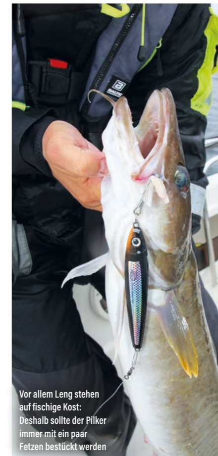
Vor allem Leng stehen auf fischige Kost: Deshalb sollte der Pilker immer mit ein paar Fetzen bestückt werden