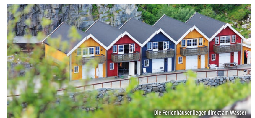
Die Ferienhäuser liegen direkt am Wasser

Ihr möchtet auch mal mit Fetzen am Kunstköder angeln und dadurch Eure Fänge deutlich steigern? Dieser Bericht und das Video dazu sind in Mittelnorwegen in der Åfjord-Kommune entstanden. Das Traumrevier bietet Euch viele Möglichkeiten zum Angeln mit gepimpten Ködern – teilweise nur wenige Bootsminuten vom Hafen