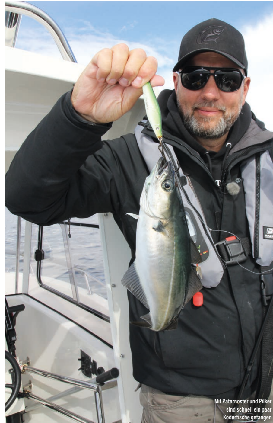
Mit Paternoster und Pilker sind schnell ein paar Köderfische gefangen