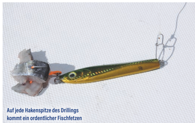
Auf jede Hakenspitze des Drillings kommt ein ordentlicher Fischfetzen

auch mal Eure Kunstköder pimpen wollt, dann achtet darauf, Eure Köderführung etwas anzupassen. Wer seinen Pilker immer mit großen Sprüngen über den Grund geführt hat, kann nun auf langsames Heben und Senken setzen. Schließlich arbeitet der Fischfetzen mit seinem Geruch für Euch mit. Extra-Tipp: Wir verwendeten Köhler, aus denen wir Streifen geschnitten haben. Wer allerdings Makrelen fängt, besitzt eine wahre Duft-