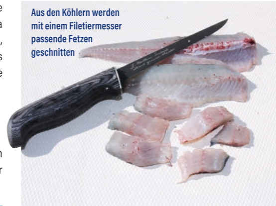
Aus den Köhlern werden mit einem Filetirmesser passende Fetzen geschnitten