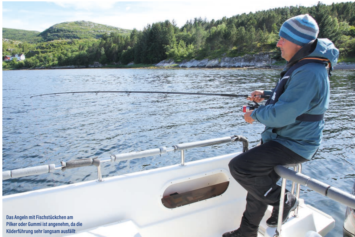
Das Angeln mit Fischstückchen am Pilker oder Gummi ist angenehm, da die Köderführung sehr langsam ausfällt

spezielle Fang ohne den Fetzen am Köder auch gebissen hätte? Das wissen wir nicht. Aber wahrscheinlich wäre dieser tolle Bursche nicht an den Haken gegangen, genauso wie die meisten anderen Räuber. Seewölfe lieben Fischfetzen und auch Leng stehen voll auf die duftenden Leckerbissen. Klar, ab und zu beißen Seewolf und Leng auch auf Gummifisch oder Pilker pur. Aber mit dem gewissen Extrapfeffer lassen sich die Fänge dieser und